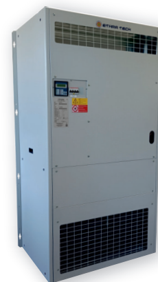
L'immagine sopra riportata è puramente a titolo indicativo The image above is purely indicative

POTENZA FRIGORIFERA DA 6,1 A 13,9kW Cooling capacity from 6,1 to 13,9kW