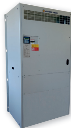
L'immagine sopra riportata è puramente a titolo indicativo The image above is purely indicative

Indoor packaged air conditioning units air cooled type, ideals for installations inside room, shelter for radio base station and data processing centre.